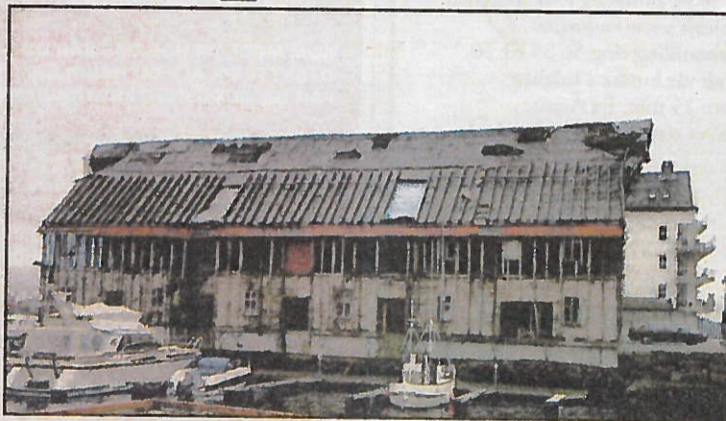
FORFALL: Slik står den fredede bygningen nå.